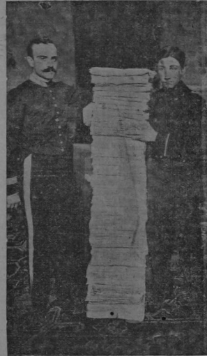
Estira de documentos existentes en el proceso

MADRID, Febrero 11.—El tropiezo del gobierno. Entre los militares ha producido mala impresión la noticia de que se va á atacar á Ferrer, creyéndose que el Conde de Romanones accederá á Se juzga éste como un paso poco habilitado, del que solo se sacarán disgustos. Hay quien dice que esos mitines los organizan los carlistas en connivencia con los conservadores, que éste será el primer